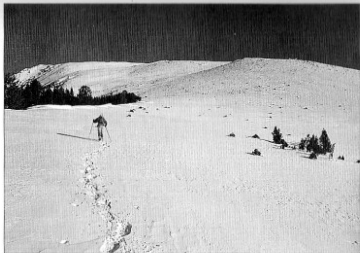
La tossa Plana de Lies des del pla de les Someres

per inclinació una mica més pronunciada, evitant més rocs, davallem a un segon replà amb pastures. Ara girem un xic a l'esquerra i ens dirigim a un llom emboscat que delimita a ponent el gran pla de les Someres (2.335 m, 4 h). Recorrem aquest esquenall per un sender, passem per les ruïnes d'una cabana de pastors i entrem en una pineda de pi negre. El camí, marcat i senyalitzat amb fites, ens duu a la pista i al Pradell (4 h 30'), el nostre punt de sortida.