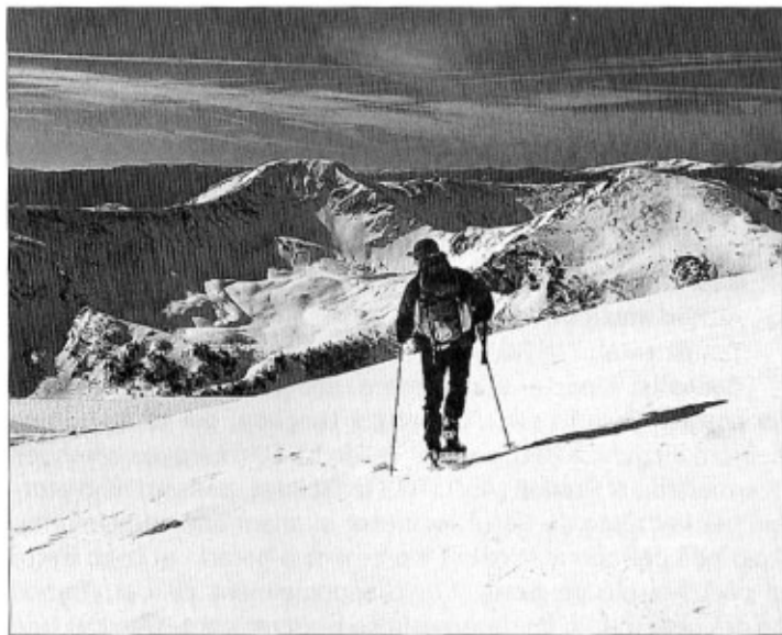
Cim del pic de la Colilla. Davant, el Monturull i el tossal de la Truita

A la mateixa pista (2.115 m), prop del refugi del Pradell, deixem a la dreta el fressat camí que puja al pla de les Someres i a la Tossa Plana de Lles. A la tornada hi baixarem. De moment seguim la pista, força planera, per on també passa el GR 11-10, variant del GR 11. Travessem el torrent de Setut. Després la pista fa un revolt a l'esquerra. Nosaltres l'abandonem (2.120 m, 10') quan ens és possible entrar al pla de Guirbo, un prat extens delimitat a l'oest pel serrat dels Cugots. Sense enfilar-nos encara a la carena d'aquest serrat, que tenim a l'esquerra, creuem el pla inclinat. El pendent és suau. Quan arribem al peu dels rocs granítics del tossal Bovinar, girem a mà esquerra i seguim un sender, desdibuixat pel pas del bestiar, que ateny el bosc de pi negre carener del serrat dels Cugots (2.330 m, 35'), on trobem les restes d'una cabana de pastor. Ara anem a la dreta, sortim del bosc i remuntem un esquenall amb blocs de roca que baixa del tossal Bovinar. El pendent és notable. Descobrim a l'esquerra el desolat clot de la Colilla